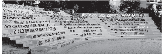
Το πριν (πάνω) και το μετά (κάτω) χαλιά, χάλια!!